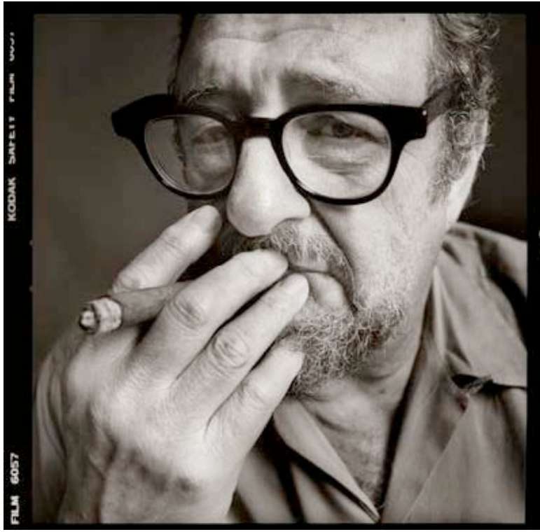
Arnold Newman, New York City, 1979